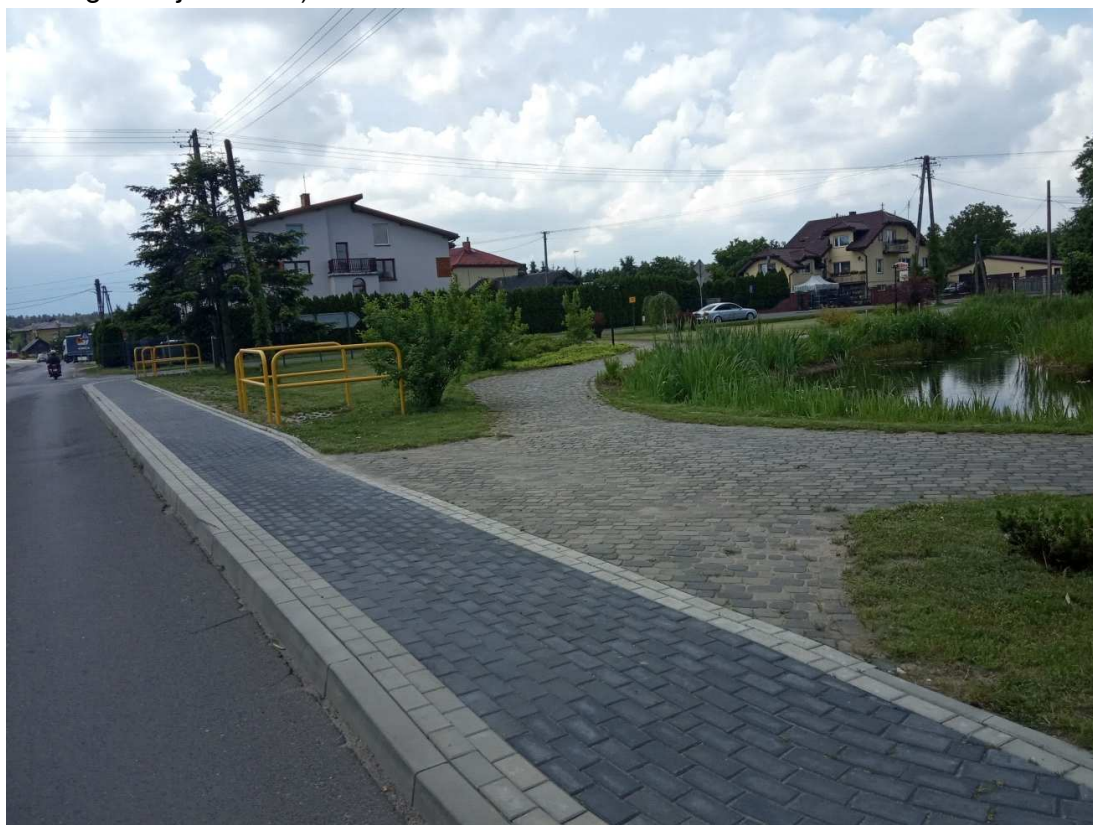
Fragment przebudowanego chodnika przy skrzyżowaniu w Budziszewicach

W trosce o bezpieczeństwo pieszych dokończona została budowa chodnika w Rękawcu (zadanie powiatu przy dużym udziale finansowym gminy) oraz przebudowany chodnik przy skrzyżowaniu w Budziszewicach (w analogicznej formule).