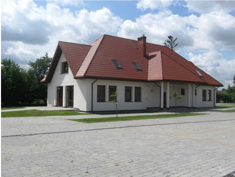
Budynek administracyjno usługowy wybudowany na placu urządzanego Budziszewickiego Ryneczku

W Budziszewicach wyróżnia się tereny pełniące funkcję ścieżek rowerowych i pieszych. Wymienić należy tutaj drogi usytuowane wzdłuż brzegu lasu i także ulicę Leśną, Osiedlową, Bartoszkówkę i Letniskową, wykorzystywane na przejażdżki rowerowe. Stąd mieszkańcy pragną usankcjonować ich charakter poprzez wybudowanie ścieżki rowerowej i szlaku pieszych w obszarach tych dróg. Mieszkańcy będą mogli wówczas wygodniej i bezkolizyjnie urządzać wyprawy piesze i rowerowe. Miejscowość stanie się bardziej atrakcyjna również dla turystów. Stanowiłaby część szlaku rowerowo-pieszego w gminie.