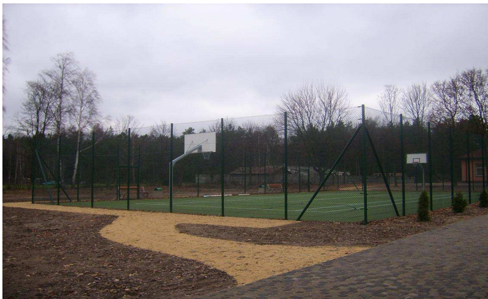
Boisko wielofunkcyjne przy Domu Ludowym w Mierznie

W Mierznie przy Domu Ludowym jest boisko wielofunkcyjne, plac wypoczynkowy z grillem (wybudowane w 2009r. ze środków UE w ramach PROW) .