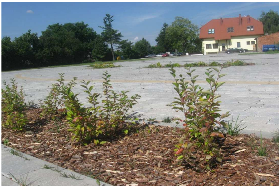
Urządzany Budziszewicki Rynecek

W centrum Budziszewic etapami urządzany jest także Budziszewicki Rynecek . Jest to teren przy Urzędzie Gminy. Powierzchnię 3051 m 2 utwardzono kostką z wyodrębnieniem charakteru przestrzeni, tj. place wielofunkcyjny, wypoczynkowy, rekreacyjno-wypoczynkowy i gospodarczy, wyposażono w oświetlenie najazdowe. W 2014/2015 wybudowano budynek administracyjno-usługowy. Na części placu nasadzono zieleni ze środków Wojewódzkiego Funduszu Ochrony Środowiska i Gospodarki Wodnej.