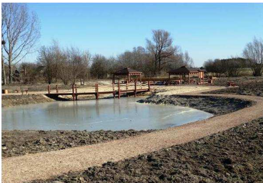
Fragment zagospodarowanego zbiornika wodnego w Węgrzynowicach

Zagospodarowania i urządzenia wymaga również teren położony w centrum miejscowości przy skrzyżowaniu dróg powiatowych i drogi gminnej. Obecnie teren nieatrakcyjny, jego położenie sprawia, iż mocno wpisuje się w przestrzeń całego obszaru.