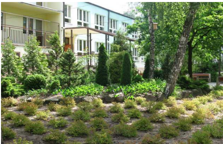
Fragment urządzonej zieleni w otoczeniu Zespołu Szkół w Budziszewicach

Dzieci zamieszkałe w wiejskiej gminie Budziszewice, mają jednak wciąż ograniczony dostęp do usług w zakresie edukacji. Dlatego też niezbędne jest podejmowanie dalszych przedsięwzięć zapewniających wyrównywanie szans naszych dzieci wiejskich w stosunku do szans dzieci zamieszkałych w miastach. Przedsięwzięć poprawiających warunki nauki poprzez realizację inwestycji w obiekt szkoły, przedszkola, w tym wyposażenie sal lekcyjnych w pomoce naukowe. Także przedsięwzięć służących rozwijaniu indywidualnego podejścia do ucznia, podnoszeniu kompetencji kadry nauczycielskiej, podnoszeniu u uczniów kompetencji kluczowych, właściwych postaw i umiejętności niezbędnych do wyboru kierunku dalszej nauki i na rynku pracy.