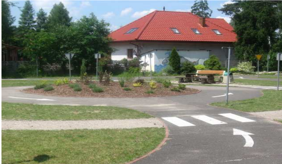
Fragment miasteczka ruchu drogowego w Budziszewicach

W centrum Budziszewic etapami urządzany jest także Budziszewicki Rynecek . Jest to teren przy Urzędzie Gminy. Powierzchnię 3051 m 2 utwardzono kostką z wyodrębnieniem charakteru przestrzeni, tj. place wielofunkcyjny, wypoczynkowy, rekreacyjno-wypoczynkowy i gospodarczy, wyposażono w oświetlenie najazdowe. W 2014/2015 wybudowano budynek administracyjno-usługowy. Na części placu nasadzono zieleni ze środków Wojewódzkiego Funduszu Ochrony Środowiska i Gospodarki Wodnej.