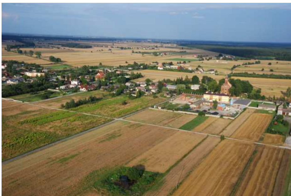
Fragment Gminy Budziszewice –przestrzeń rolnicza

W gminie Budziszewice gospodarcze wykorzystanie zasobów oparte jest na działalności rolniczej, prowadzonej w gospodarstwach indywidualnych.