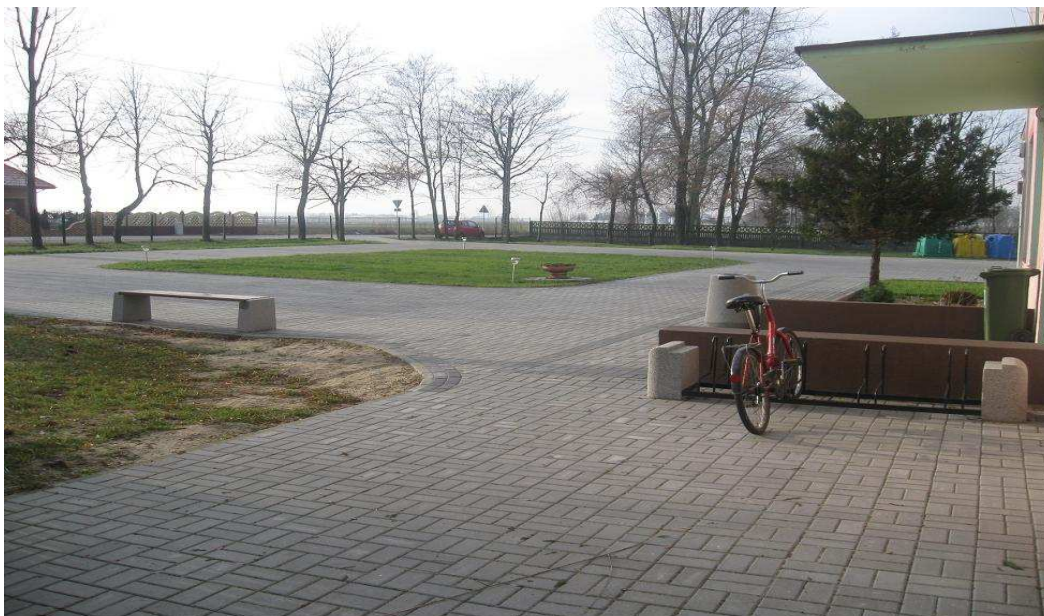
Fragment strefy reprezentacyjnej w Rękawcu

W Rękawcu - otoczenie Punktu Przedszkolnego to przestrzeń o charakterze rekreacyjno-sportowym. Są tam boisko wielofunkcyjne, lodowisko (urządzone w 2014 roku ze środków UE w ramach PROW) strefa reprezentacyjna (urządzona w 2013 roku ze środków UE w ramach LEADER). Całość wyposażona w elementy małej architektury i lampy solarne.