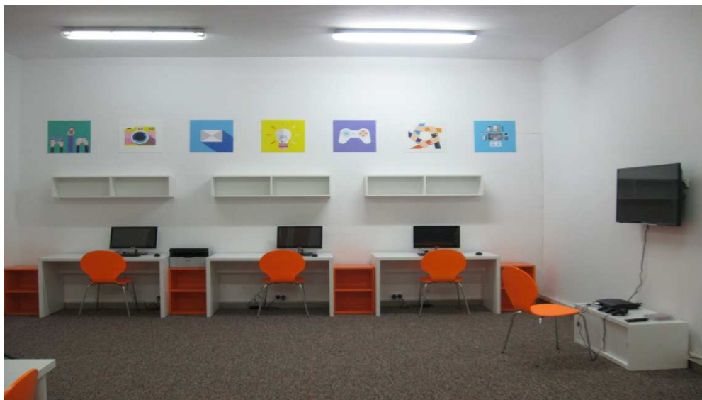
Pracownia Orange w świetlicy wiejskiej w Węgrzynowicach

Działalności kulturalnej służą także Dom Ludowy w Mierznie i Świetlica w Węgrzynowicach wraz z urządzoną do dyspozycji mieszkańców pracownią komputerową Orange.