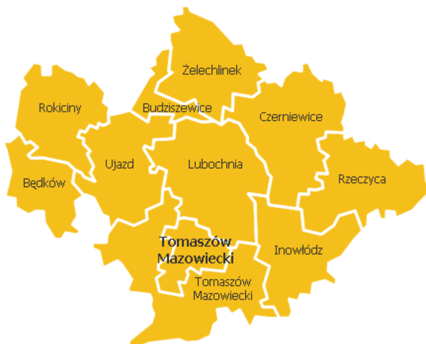
Rys.1. Położenie gminy Budziszewice w powiecie tomaszowskim.

Graniczy z trzema gminami powiatu tomaszowskiego: Żelechlinek ,Ujazd i Lubochnia oraz jedną gminą powiatu łódzkiego wschodniego : Koluszki.