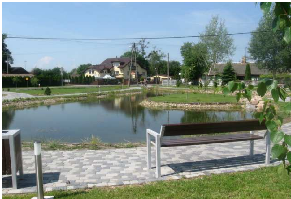
Fragment parku w Budziszewicach

W Budziszewicach - w centrum miejscowości przy skrzyżowaniu dróg wojewódzkiej i powiatowej jest park wraz z układem wodnym, zrewitalizowany w 2013 roku.