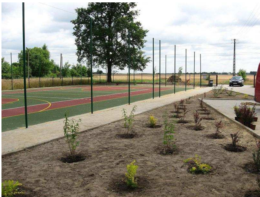
Fragment boiska sportowego z urządzoną zielenią przy świetlicy w Węgrzynowicach