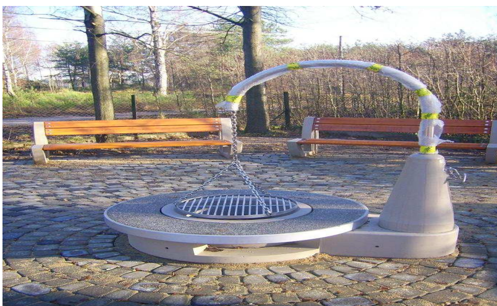
Plac wypoczynkowy w grillem przy Domu Ludowym w Mierznie

Od 2014 roku funkcjonuje plac zabaw z wykorzystaniem energii odnawialnej (wybudowany ze środków UE w ramach LEADER).