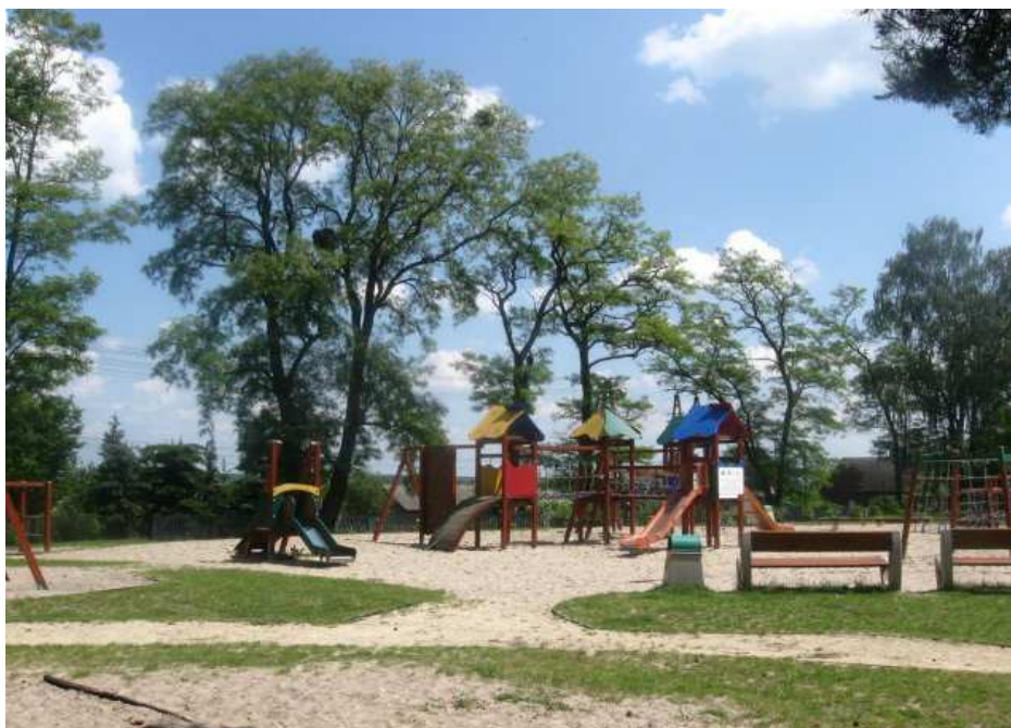
Fragment placu zabaw w Budziszewicach

W terenie szkolnym znajdują się wybudowane w 2009 roku ogólnodostępny plac zabaw i miasteczko ruchu drogowego, oraz boisko szkolne wybudowane w 2010 roku.