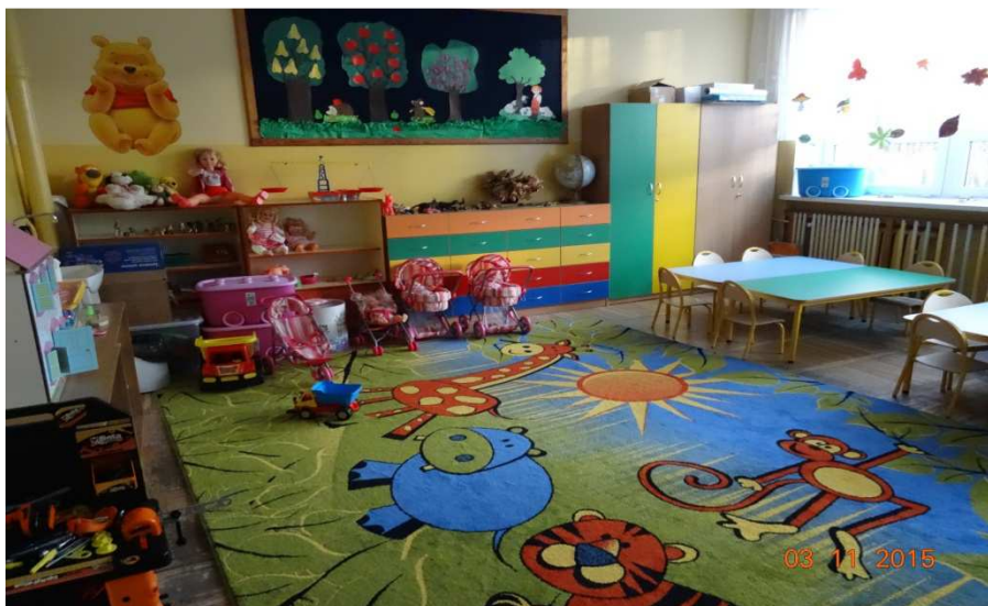
Oddział Przedszkolny w Zespole Szkół w Budziszewicach-po doposażeniu

Na terenie gminy funkcjonuje Zespół Szkół w Budziszewicach. W jego strukturę organizacyjną wchodzi Publiczne Gimnazjum w Budziszewicach i Szkoła Podstawowa w Budziszewicach, od 2008 roku Punkt Przedszkolny w Rękawcu. Budynek szkoły istnieje 20 lat. Stan dobry. Niezbędne remonty wykonywane są na bieżąco. Sukcesywnie, w miarę możliwości finansowych, podejmowane są remonty podnoszące standard budynku jak również wyposażane są sale dydaktyczne, na przykład w 2015 roku wyposażono oddział przedszkolny w ramach Programu Operacyjnego Kapitał Ludzki.